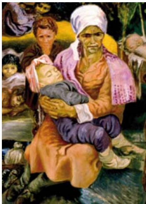
Carlo Levi, particolare del Telero «Lucania '61»

È in questa comune frequentazione dell'arte «nordica» che si trova un altro sentimento comune ai due artisti: una sorta di sottile malinconico fatalismo. La realtà, sia essa rappresentata dai contadini di Levi o dalle ragazze campagnole di Tabusso, è, in ambedue, rappresentata come immutabile. La realtà sociale di Levi non prevede, in pittura,