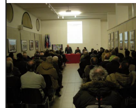
Fondazione Amendola 2 febbraio 2011

IL FUTURO DEI SERVIZI PUBBLICI di Mimmo Carretta a pag. 3