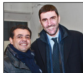
MAURO LAUS LUCANI PER GARIGLIO